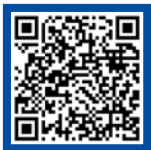
مقاله طراحی محیط یادگیری الکترونیکی

محیط می‌تواند به فرصتی ترغیبی در رفتار یادگیرنده بدل شود. از جمله ریشه‌های علاقه دانش‌آموز به یادگیری، به محیط آموزشی وابسته است. در صورت ناهماهنگ بودن محیط با انتظارات فرد، حس دافعه و نبود علاقه به یادگیری قوت می‌گیرد. با این همه، محیط یادگیری تنها به بخش فیزیکی محدود نیست و محیط‌های عاطفی، روانی و اجتماعی نیز در اثرگذاری بر حال یادگیری جایگاه مهمی دارند. از سوی دیگر، محیط الکترونیکی شکل تازه‌ای از پیرامون یادگیری را به تصویر آورده است. در این حالت، علاوه بر ابعاد روانی و اجتماعی یادگیری، فضای فیزیکی کلاس درس تغییرات ویژه خود را دارد که لازم است در توانمندی حرفه‌ای معلمان مورد توجه قرار گیرد.